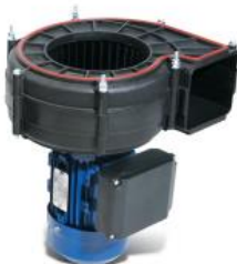
SVM- Y 3-37

Вакуумный двигатель (3 фазы) - мощный двигатель